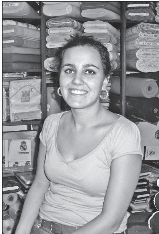
del Traje 2010. (Madrid).

en sala de exposiciones “Matadero” 2009. (Madrid); Desfile de 4º curso en Museo