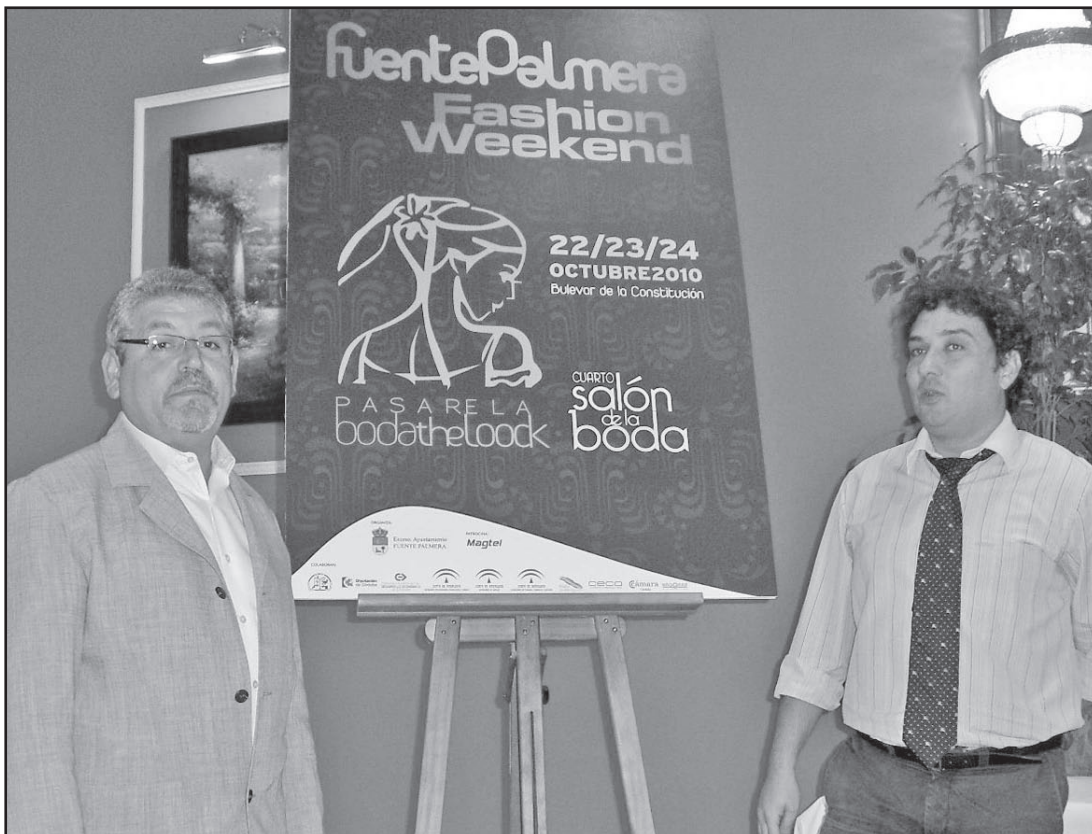
Presentación del cartel por el Alcalde y el Presidente de la Asociación de Empresarios.