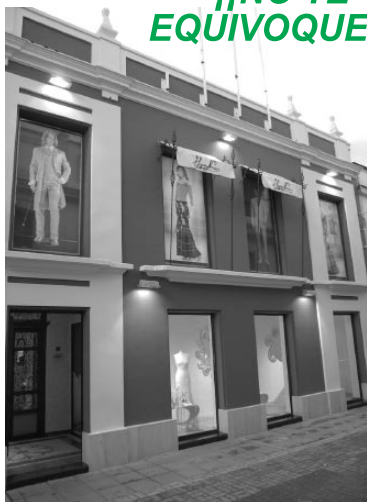
C/. Portales, 4 - Tlf. 957 63 86 88

www.higarnovias.com FUENTE PALMERA (Córdoba)